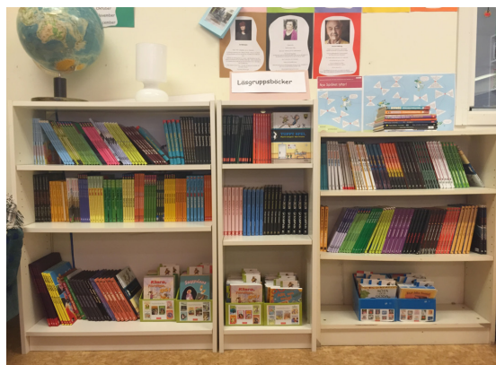
Läsgruppsbibliotek lättillgängligt i klassrummet

Arbetet med läsgrupperna kan se olika ut från år till år. Barnens behov styr till stor del hur vi organiserar oss. De senaste läsåren har ettorna jobbat i sin klass i läsgrupper, enligt Kiwi-materialet. Tvåor och treor har arbetat tillsammans i läsgrupper en gång per vecka. Vi ser många fördelar med att blanda de två årskurserna. Alla barn har knäckt läskoden men befinner sig på olika